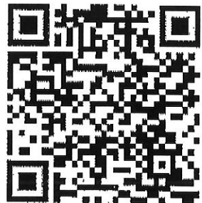
QR Code สิ่งที่ส่งมาด้วย

รองผู้อำนวยการสถาบันบริหารจัดการธนาคารที่ดิน ปฏิบัติหน้าที่แทน ผู้อำนวยการสถาบันบริหารจัดการธนาคารที่ดิน