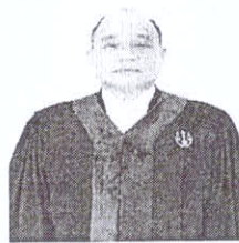
นายอาทร คุระวรรณ อธิบดีศาลปกครองสงขลา