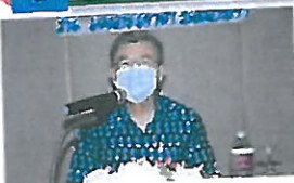
รองผู้ว่าราชการจังหวัดชลบุรี กล่าวเปิดการประชุม