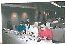
ผู้เข้าร่วมประชุมรับฟังการบรรยาย