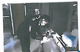
ผู้เข้าร่วมลงทะเบียน