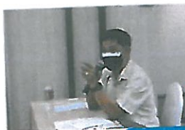
ผู้เข้าร่วมประชุมแสดงความคิดเห็น