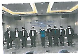
การถ่ายภาพร่วมกัน