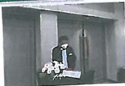
ผู้อำนวยการสำนักงานทางหลวงชนบทที่ 3 กล่าวรายงานการประชุม