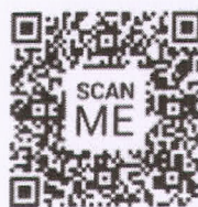
เอกสารการรับสมัคร