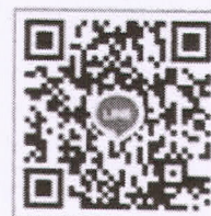
กลุ่มไลน์ รับสมัคร จอส.๕๐๔ ภาค ๑ วันที่ ๒/๖๕