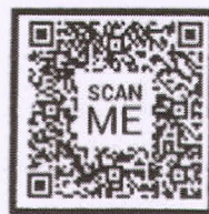
บันทึกข้อมูลส่วนบุคคล (Google Form)